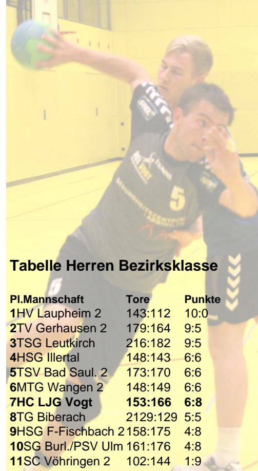
Tabelle Herren Bezirksklasse

Der Sieger kann sich im Dichtgedrängten Mittelfeld der Tabelle festkrallen, der Verlierer muss wohl erst mal abreißen lassen. Nach dem man letzte Woche auswärts mal wieder ohne Auswechselspieler antreten musste, hofft man das sich die Personalsituation heute etwas entschärft. Man hat gesehen wie wichtig es ist wenn man am Ende noch Wechselmöglichkeiten hat. Vom Papier her ist das heute sicher eine lösbare Aufgabe, doch tun sich die HCL `er vor allem in solchen Spielen in denen der Druck des „gewinnen müssen“ recht schwer. Ausschlaggebend ist, wie gut man das Gegenstoßspiel der Gäste in den Griff bekommt und das Spiel über den Kreis. Das verlangt eine konsequente Abwehrarbeit und optimale Chancenverwertung. Mit einem Heimsieg könnte man einen großen Schritt in Richtung Nichtabstieg machen. Hoffen wir, dass der HCL heute das ausgeschlafenerere Team ist und sein Spiel durch bringt.